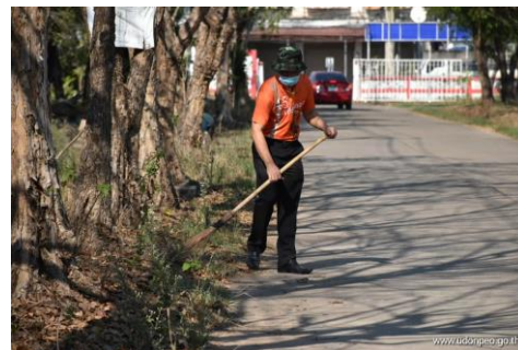
ภาพกิจกรรมจิตอาสาพัฒนาสำนักงานศึกษาธิการจังหวัดอุดรธานี