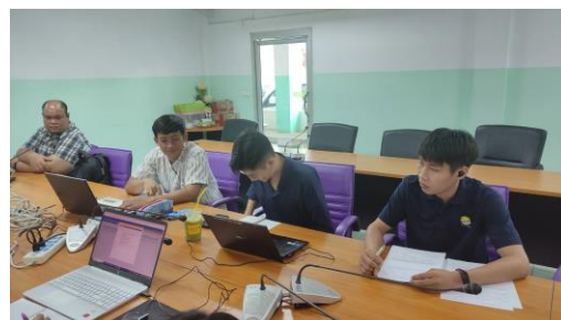
ภาพกิจกรรมอบรมจัดอบรมระบบ PMSS ให้กับข้าราชการบรรจุใหม่ ของสำนักงานศึกษาธิการจังหวัดอุดรธานี และผู้สนใจทบทวนการใช้ระบบ